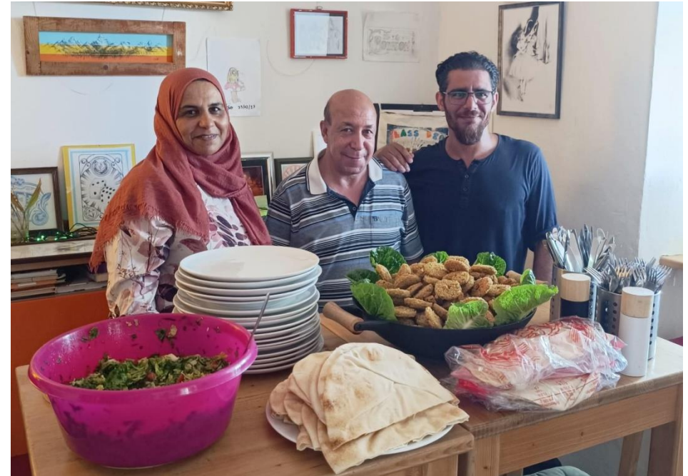
Willkommen im Café grenzenlos

Wir begegnen Flüchtlingen und Aussiedler*innen mit Respekt und stehen ihnen auch bei der psychischen Bewältigung ihrer schwierigen Lebenssituation zur Seite.