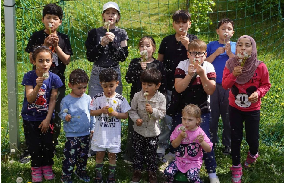
Kinder im ÜWH Witttstraße

Seit den 90er Jahren beraten wir Flüchtlinge in den Gemeinschaftsunterkünften (GU) in Landshut, seit 2017 Aussiedler*innen, Kontingentflüchtlinge und Ortskräfte im Übergangwohnheim (ÜWH) und seit 2022 auch ukrainische Kriegsflüchtlinge in einer städtischen Unterkunft, vor allem Frauen und Kinder. Insgesamt begleiten wir in den Unterkünften ca. 800 1.000 Menschen, darunter viele Familien. Die allermeisten von ihnen müssen für eine lange Zeit unter den schwierigen Umständen der Gemeinschaftsunterbringung leben.