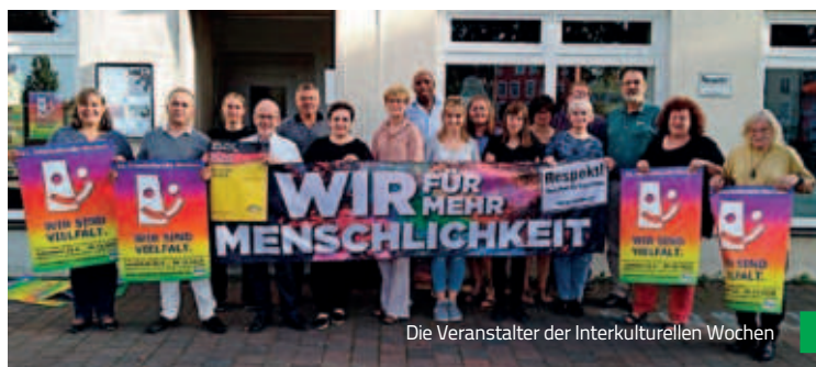
Die Veranstalter der Interkulturellen Wochen

Mit unseren Veranstaltungen konnten wir 2018 über 1.500 Teilnehmer*innen erreichen. Vielen Dank für das Interesse und die gute Zusammenarbeit an unsere vielfältigen Kooperationspartner*innen!