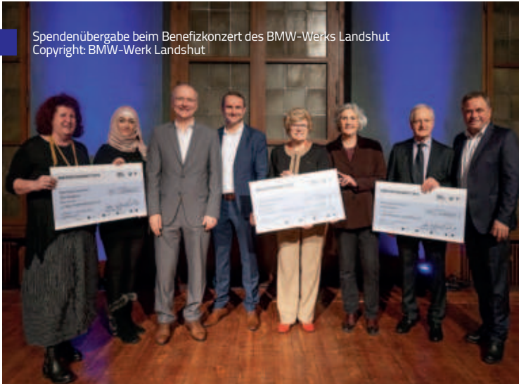
Spendenübergabe beim Benefizkonzert des BMW-Werks Landshut