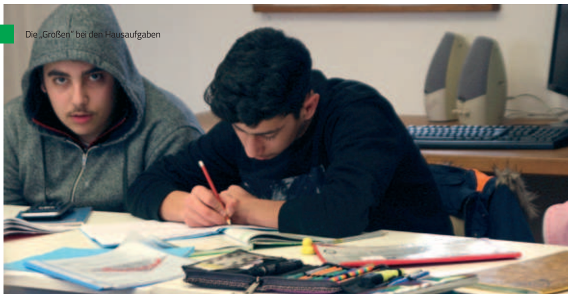
Die „Großen“ bei den Hausaufgaben

Bayerisches Staatsministerium des Innern, für Sport und Integration