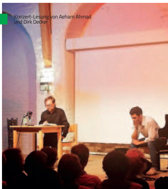
Konzert-Lesung von Aeham Ahmad und Dirk Decker

Neben dem laufenden Veranstaltungsprogramm im Café international und in der Rochuskapelle organisierte das Haus International 2018 wieder Einzelveranstaltungen an anderen Orten, vorzugsweise im Jugendkulturzentrum Alte Kaserne, im AWO-MehrGenerationenHaus oder im Salzstadel, oft als Kooperationsprojekte und immer mit viel ehrenamtlicher Beteiligung.