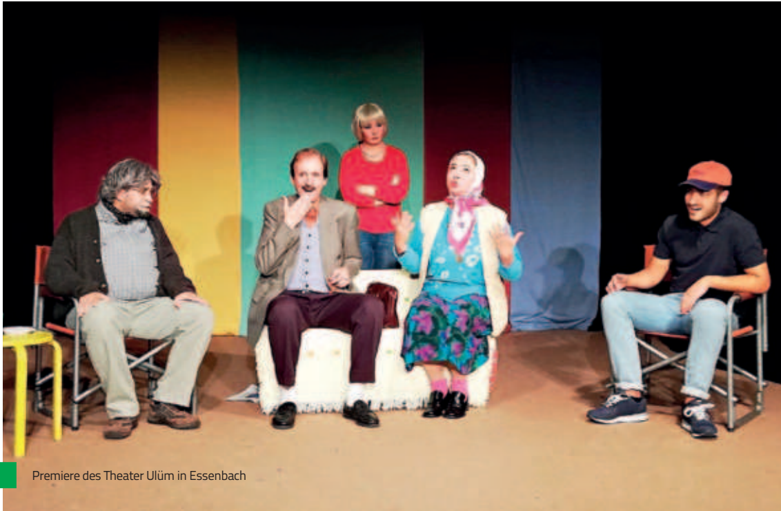
Premiere des Theater Ulüm in Essenbach