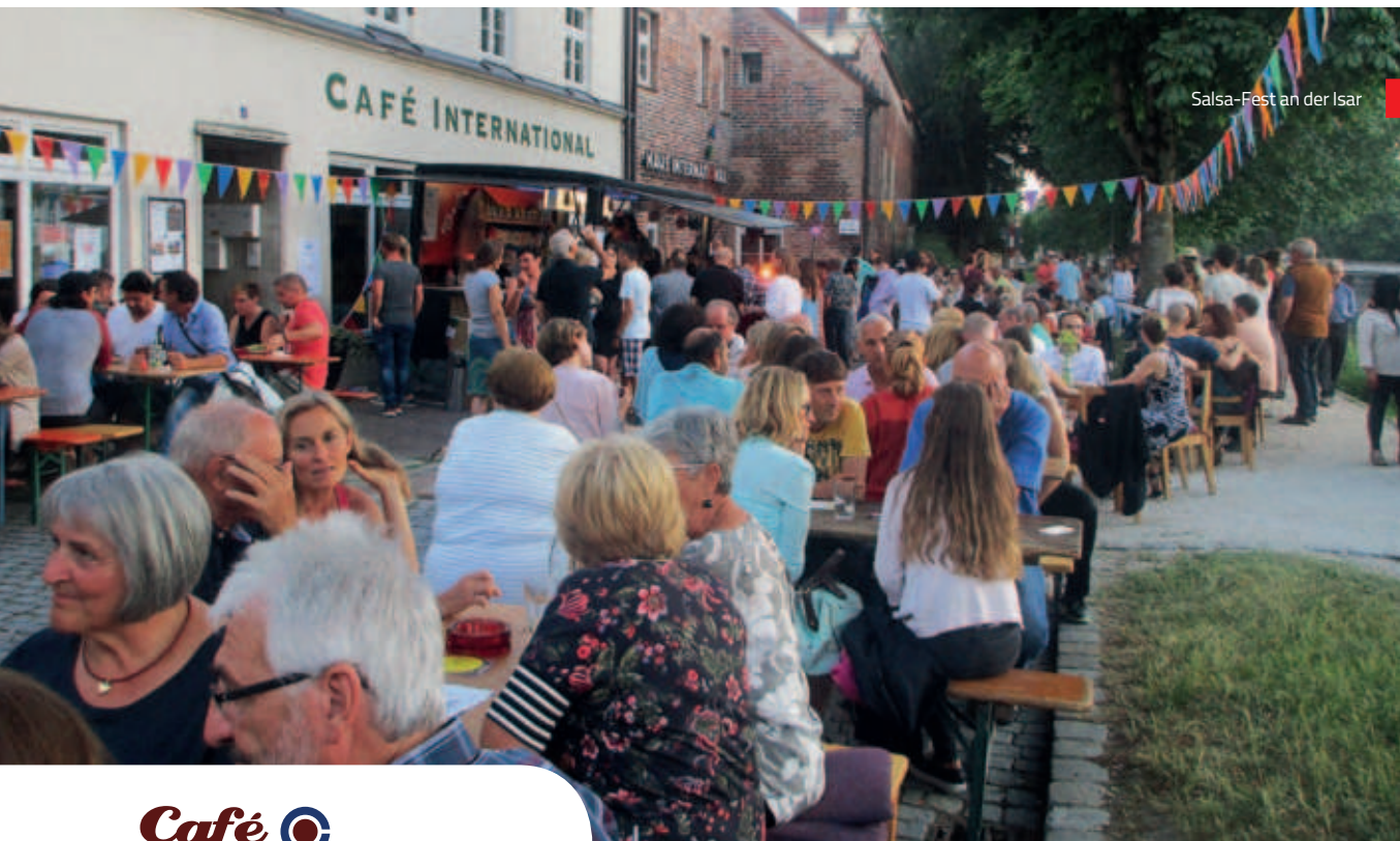
Salsa-Fest an der Isar