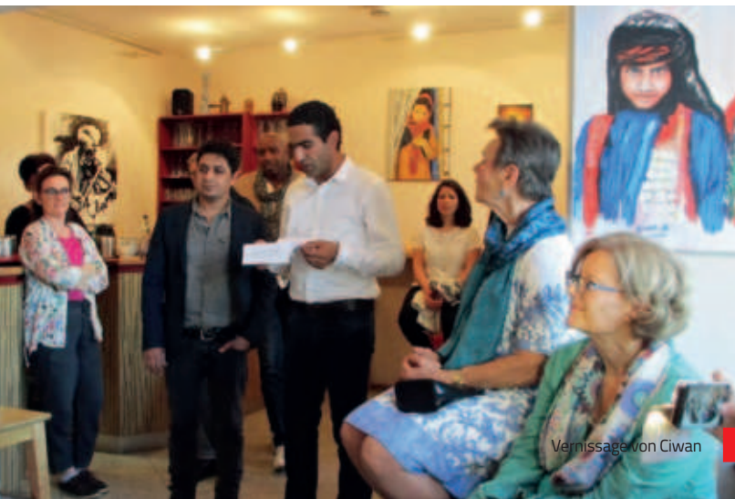
Vernissage von Ciwan