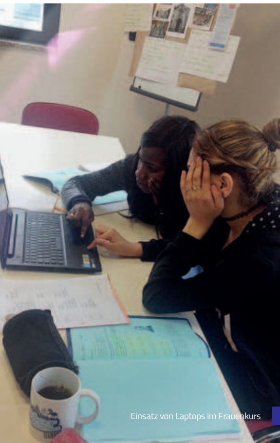
Einsatz von Laptops im Frauenkurs

Die Integrationskurse, die wir im Auftrag des Bundesamts für Migration und Flüchtlinge (BAMF) durchführen, sind im MehrGenerationenHaus (MGH) der AWO in der Ludmillastraße 15 angesiedelt. Auch im Jahr 2018 wurden alle drei Unterrichtsräume vormittags, nachmittags und abends genutzt. Zusätzlich zu den ausgelagerten Integrationskursen am Orbankai und in der GU Niedermayerstraße wurde ab Herbst ein zusätzlicher Kursraum im Landshuter Netzwerk eingerichtet. Die Zusammenarbeit mit der AWO und den Kooperationspartner*innen vor Ort ist sehr gut.