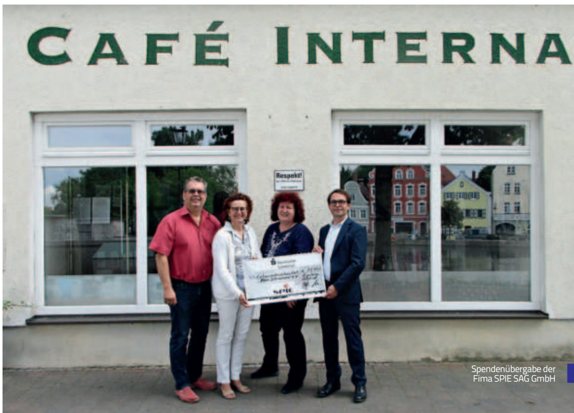
Spendenübergabe der Firma SPIE SAG GmbH

Wir sagen ein besonders herzliches Dankeschön an die Landshuter Bürgerschaft, die das Haus International 2018 wieder großzügig mit Geld- oder Sachspenden unterstützte.