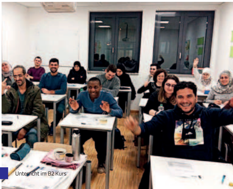
Unterricht im B2 Kurs

Seit 2018 bietet das Haus International neben den Integrationskursen auch Kurse der berufsbezogenen Deutschsprachförderung (DeuföV) an. Die Kurse werden vom Bundesamt für Migration und Flüchtlinge (BAMF) finanziert und bieten Migrant*innen und Flüchtlingen, die einen Integrationskurs abgeschlossen haben, die Möglichkeit ihre Deutschkenntnisse zu vertiefen. Die Kurse umfassen 400 bzw. 500 Unterrichtsstunden.