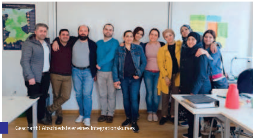
Geschafft! Abschiedsfeier eines Integrationskurses

Sieben Mal wurde der obligatorische Abschlusstest „Deutsch für Zuwanderer“ (DTZ) und sechs Mal der Test „Leben in Deutschland“ (LiD) nach dem Orientierungskurs durchgeführt – drei der Prüfungen fanden jeweils in den Alpha-Kursen statt. Die Anzahl der Teilnehmer*innen lag bei den DTZ-Prüfungen bei 113 und bei den LiD-Prüfungen bei 90.