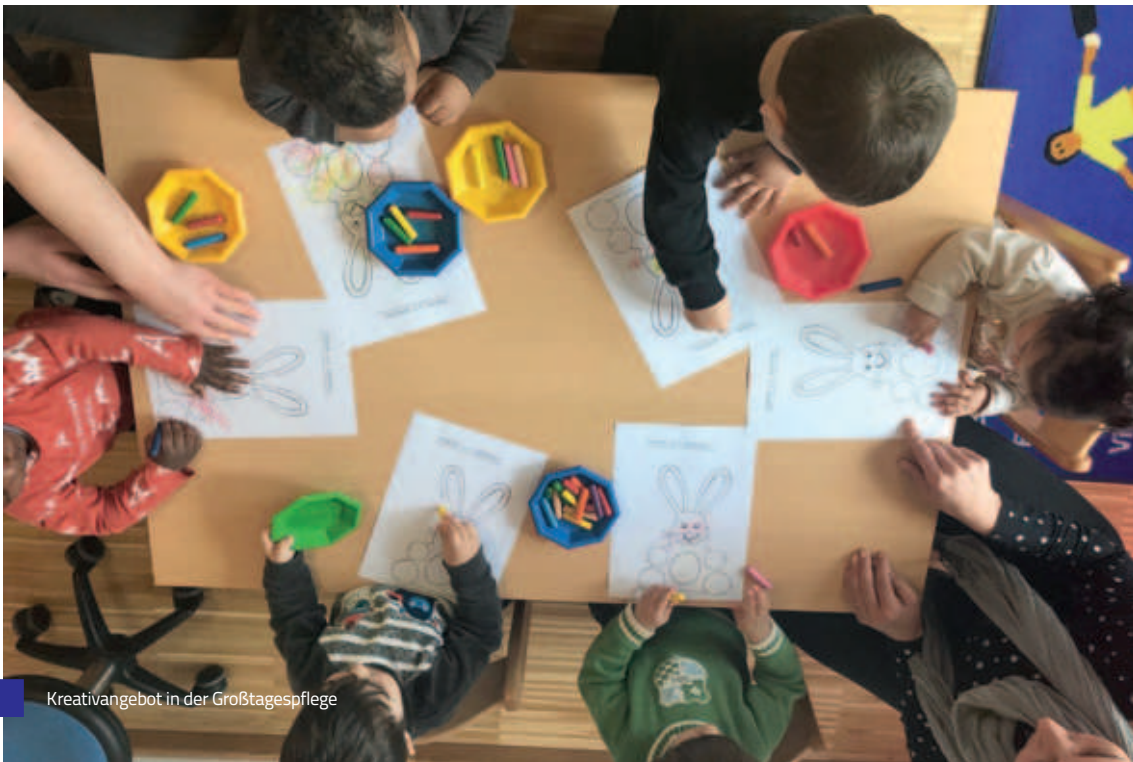
Kreativangebot in der Großtagespflege

Seit 2015 gibt es eine Interkulturelle Großtagespflege für Mütter, die am Vormittag die Integrationskurse des Haus International im MehrGenerationenHaus (MGH) der AWO besuchen.