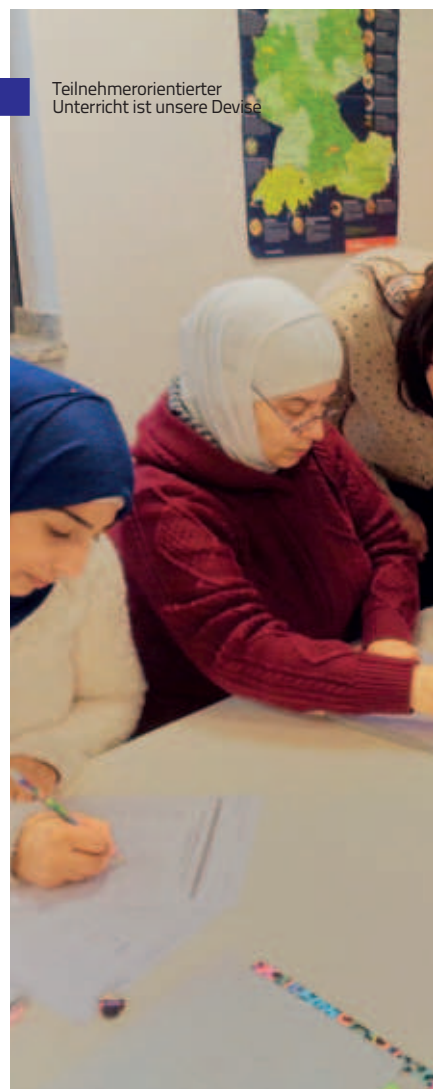
Teilnehmerorientierter Unterricht ist unsere Devise

Durch den drei- bzw. viertägigen, teilnehmerorientierten Unterricht entstehen in den Kursen ein guter Gruppenzusammenhalt und ein förderliches soziales Lernklima. Die Spezialkurse haben ein höheres Stundenkontingent, was den Lehrkräften die Möglichkeit gibt, die Teilnehmer*innen ein Stück weit auf ihrem Kenntnisstand abzuholen. Auch das familiäre Klima trägt dazu bei, dass die Teilnehmer*innen gerne zum Unterricht kommen und das Haus International im Familien- und Freundeskreis weiterempfehlen. Hier sei auch der engagierte Einsatz der Kursleiter*innen erwähnt, die neben dem Vermitteln von Deutschkenntnissen ihren Beitrag zum Empowerment der Teilnehmer*innen leisten.