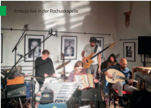
Embryo live in der Rochuskapelle

Die Rochuskapelle als Kulturraum hat sich in Landshut inzwischen sehr gut etabliert. Das historische Umfeld mit der alten Stadtmauer und die moderne Architektur der Ursulinen-Turnhalle ergänzen sich hervorragend. Diese ruhige Oase im Herzen der Stadt bietet für das Kulturprogramm viele Möglichkeiten.