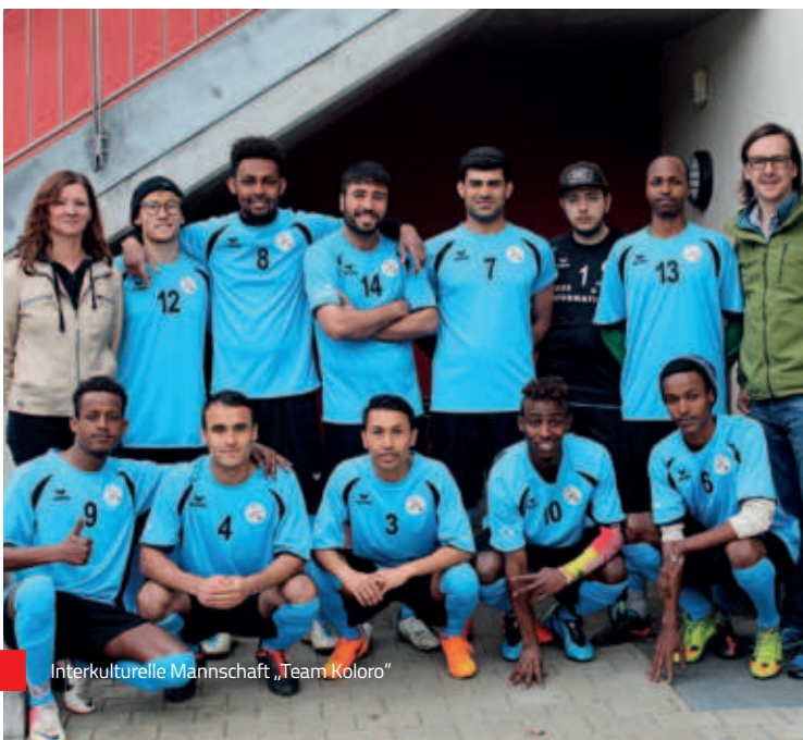
Interkulturelle Mannschaft „Team Koloro“

Bitte begleiten und unterstützen Sie uns weiter auf diesem Weg!