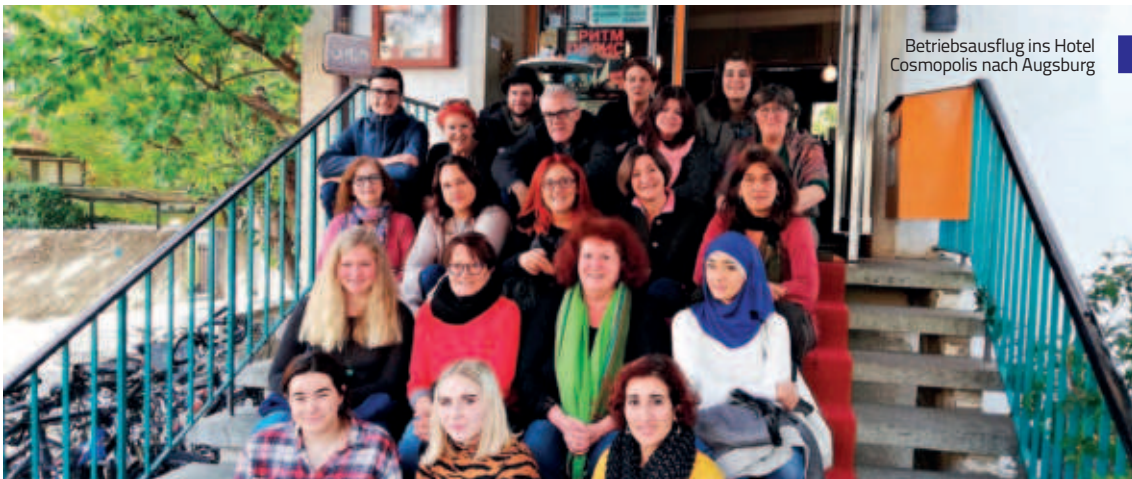
Betriebsausflug ins Hotel Cosmopolis nach Augsburg