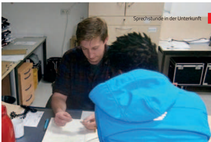
Sprechstunde in der Unterkunft

Am 1.1.2018 wurde in Bayern mit der Richtlinie für die Förderung der sozialen Beratung, Betreuung und Integration von Menschen mit Migrationshintergrund (Beratungs- und Integrationsrichtlinie - BIR) die Struktur und die staatliche Förderung der Integrationsarbeit gänzlich neu geregelt. Auch die Zuständigkeit wechselte vom Sozialministerium in das Staatsministerium des Innern, für Sport und Integration.