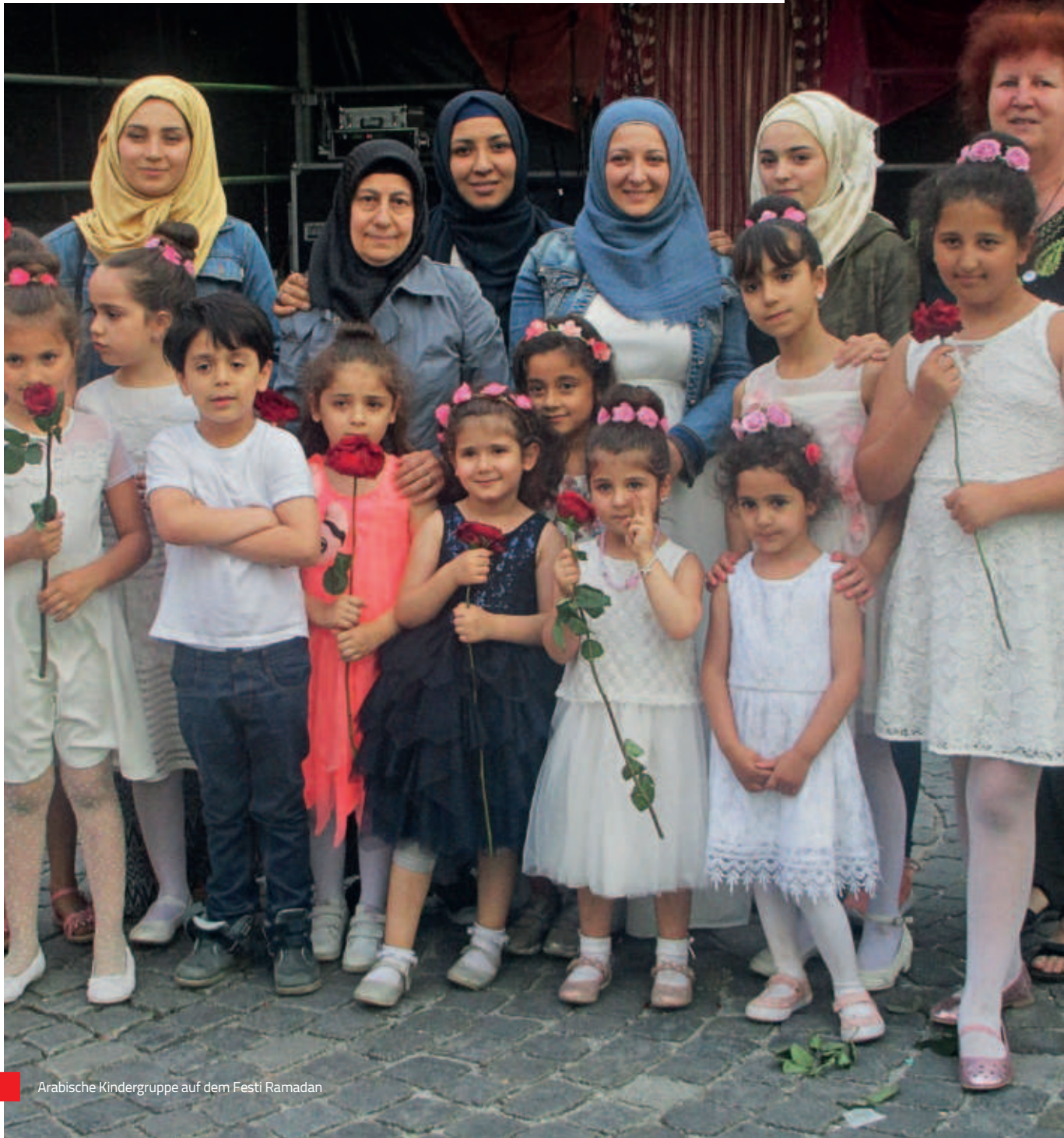
Arabische Kindergruppe auf dem Festi Ramadan