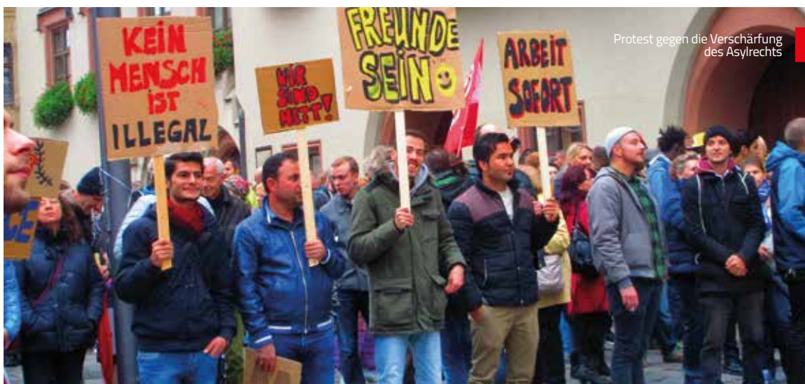
Protest gegen die Verschärfung des Asylrechts

Die Koordinierung der ehrenamtlichen Angebote und Anleitung der Ehrenamtlichen oblag den Asylsozialarbeitern. Für einzelne Projekte wurden auch ehrenamtliche Koordinatoren eingesetzt. Einige Ehrenamtliche besuchten regelmäßig Familien und begleiteten Asylbewerber bei Amtsgängen und Arztbesuchen oder unterstützen sie bei der Wohnungssuche. Auch Sportangebote wie Fußball wurden von Ehrenamtlichen aktiv begleitet. Insgesamt waren 53 Ehrenamtliche in der Flüchtlingshilfe vor Ort tätig.