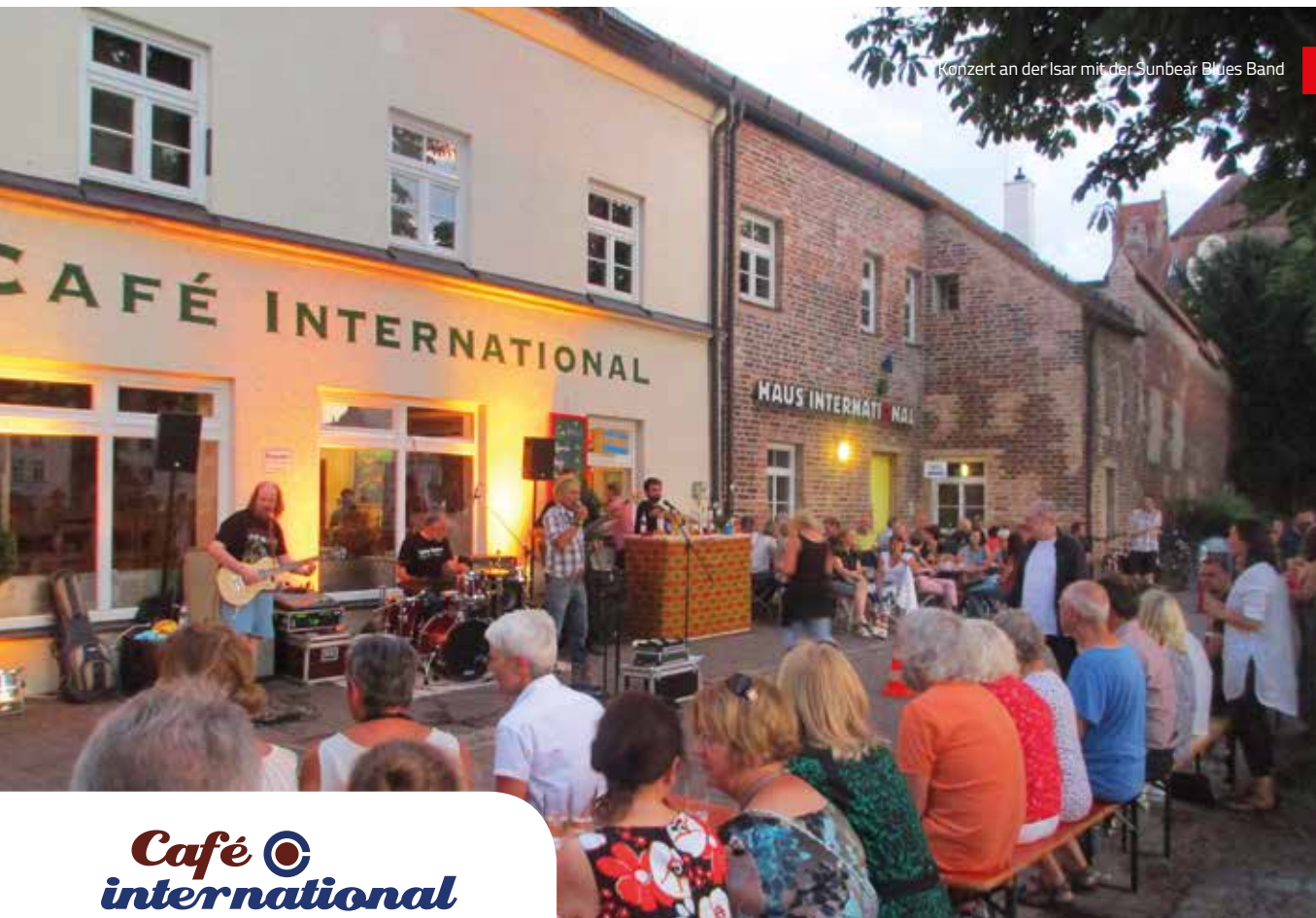
Konzert an der Isar mit der Sunbear Blues Band