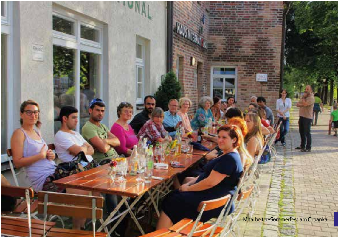
Mitarbeiter-Sommerfest am Orbankai