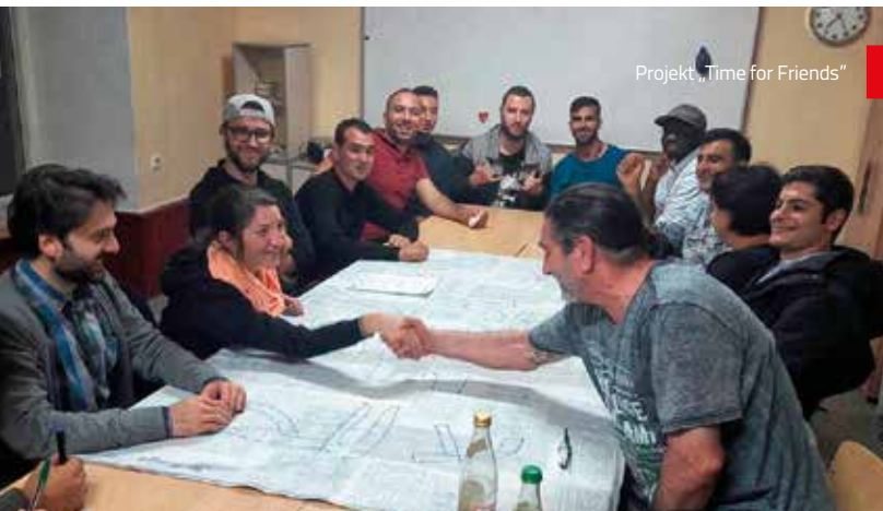
Projekt „Time for Friends“

Vielen Dank für das große Engagement und die gute Kooperation an alle Café-Mitarbeiter und die Nutzergruppen!