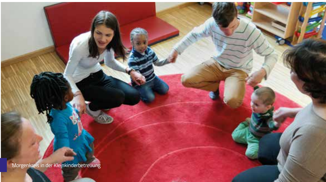
Morgenkreis in der Kleinkinderbetreuung

Seit 1.11.15 gibt es das Angebot einer Interkulturellen Großtagespflege für Mütter, die am Vormittag die Integrationskurse des Haus International im MehrGenerationenHaus (MGH) der AWO besuchen.