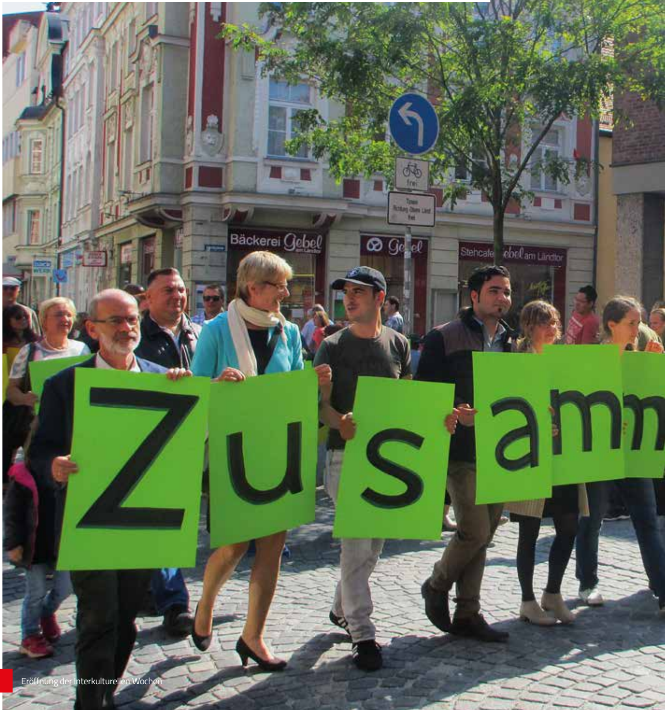
Eröffnung der Interkulturellen Wochen