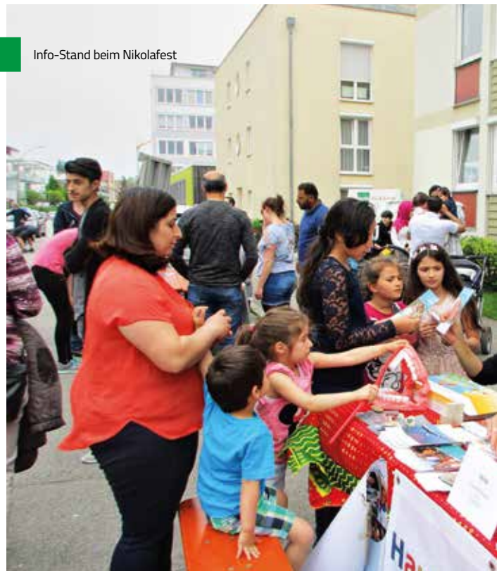
Info-Stand beim Nikolaifest