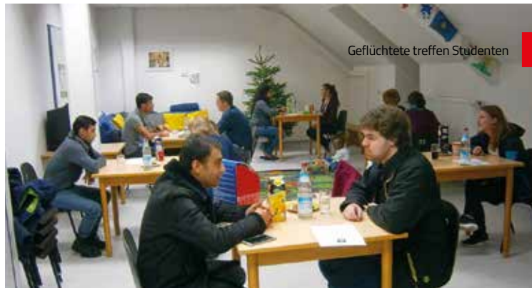
Geflüchtete treffen Studenten

Einmal wöchentlich fand weiterhin die Frauengruppe statt. Auch das Gesundheitsprojekt Migranten für Migranten (MiMi) war wieder regelmäßig mit Vorträgen zu verschiedenen Gesundheitsthemen zu Gast in der Frauengruppe. Gesundheitsprävention und Kindergesundheit sind wichtige Themen, denn durch die schon in den Heimatländern belastende Situation