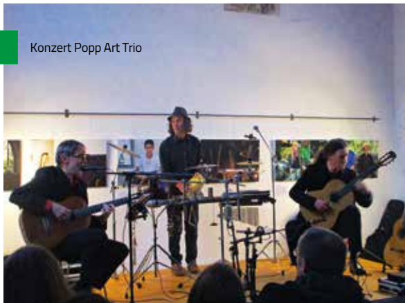
Konzert Popp Art Trio

Die Rochuskapelle als Kulturraum hat sich in Landshut inzwischen sehr gut etabliert. Das historische Umfeld mit der alten Stadtmauer und die moderne Architektur der Ursulinen-Turnhalle ergänzen sich hervorragend. So ist eine ruhige Oase im Herzen der Stadt entstanden, die auch für das Kulturprogramm der Kapelle viele neue Möglichkeiten bietet