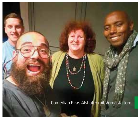
Comedian Firas Alshater mit Veranstaltern