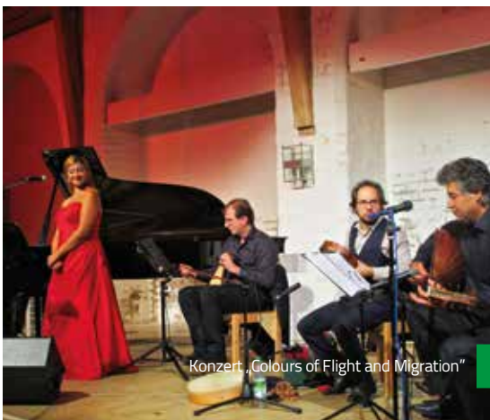
Konzert „Colours of Flight and Migration“

kreativen und umfangreichen Programm, wie Sie es in Landshut alljährlich auf die Beine stellen, steckt viel Engagement, Arbeit und Zeit. Auch in diesem Jahr ist es Ihnen wieder gelungen, facettenreich die Stärke der Vielfalts-gesellschaft zu präsentieren ohne Probleme zu verschweigen und auch auf Missstände aufmerksam zu machen. Das Engagement für gleichberechtigte Teilhabe aller hier lebenden Menschen hat an Wichtigkeit nicht verloren und auch das Ermöglichen von direkten Begegnungen als Weg zum gegenseitigen Verständnis ist sicherlich so aktuell wie 1986.“