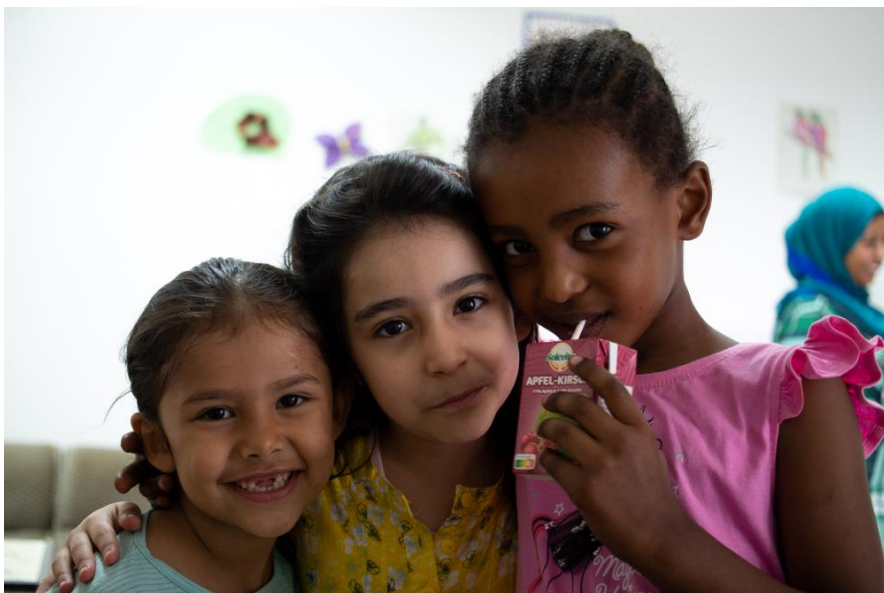
Kindergruppe in der GU Niedermayerstraße

Seit den 90er Jahren beraten wir Flüchtlinge in den Gemeinschaftsunterkünften (GU) in Landshut, seit 2017 auch Aussiedler*innen, Kontingentflüchtlinge und Ortskräfte im Übergangwohnheim (ÜWH) und seit Sommer 2022 auch ukrainische Kriegsflüchtlinge in einer städtischen Unterkunft, vor allem Frauen und Kinder. Insgesamt begleiten wir in den Unterkünften fast 1.000 Menschen, darunter viele Familien. Die allermeisten von ihnen müssen für eine lange Zeit unter den schwierigen Umständen der Gemeinschaftsunterbringung leben.