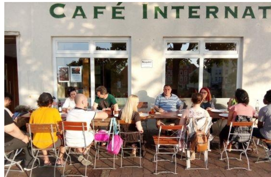
Willkommen im Café grenzenlos

Wir begegnen Flüchtlingen und Aussiedler*innen mit Respekt und stehen ihnen auch bei der psychischen Bewältigung ihrer schwierigen Lebenssituation zur Seite.